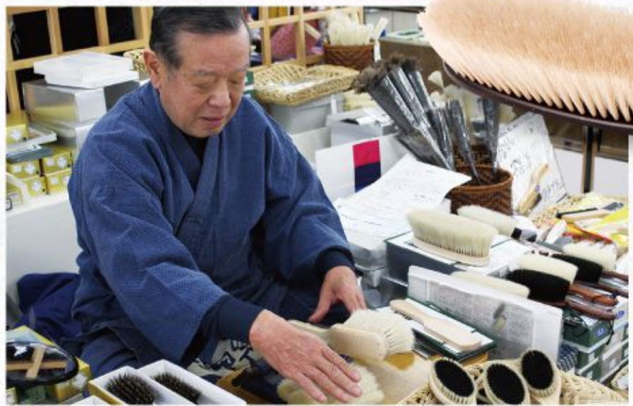
ブラシの平野 [ブラシ/東京]

洋服ブラシ カシミア (28cm) 10,800円 カシミアなどのデリケートな素材にも安心な馬毛を使用。きめ細かい毛を使用している為、細かなホコリも取り除きます。黒綿襪使用。