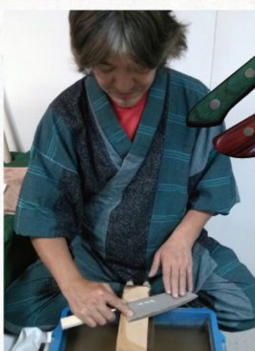
オクゼン [堺業平刃物/大阪]

①堺業平三徳包丁 (刃渡り16.5cm/安来青紙1号鋼) 限定6点 19,440円