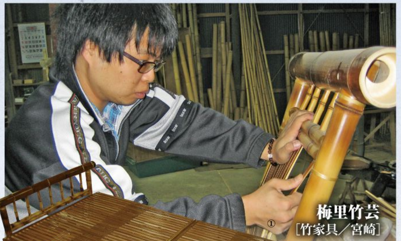
梅里竹芸 [竹家具/宮崎]

①ベンチベッド (W100×L120~200×H37cm/竹・杉) 302,400円 通気性のよいスライド式ベッド。縮めるとイスとテーブルに変身。